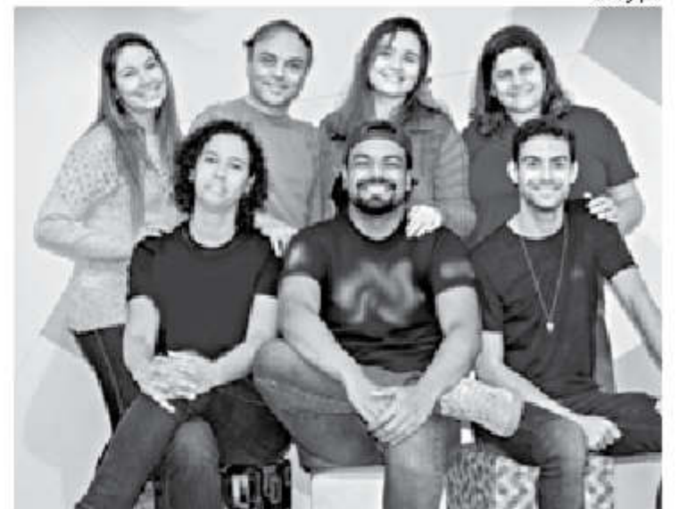
DIAULA Espaço de Estudos inaugura sua proposta de trabalho unindo diversas áreas